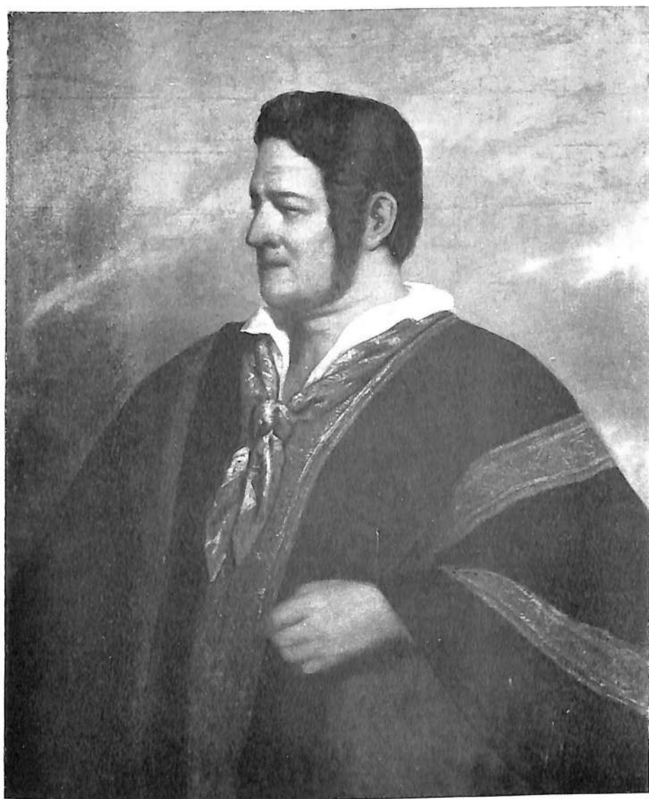
Nº 4. Juan Manuel de Rosas