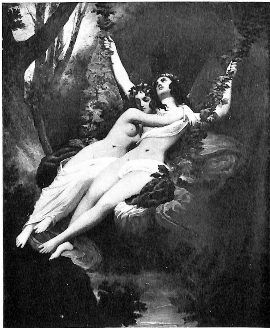
Nº 23. El Columpio