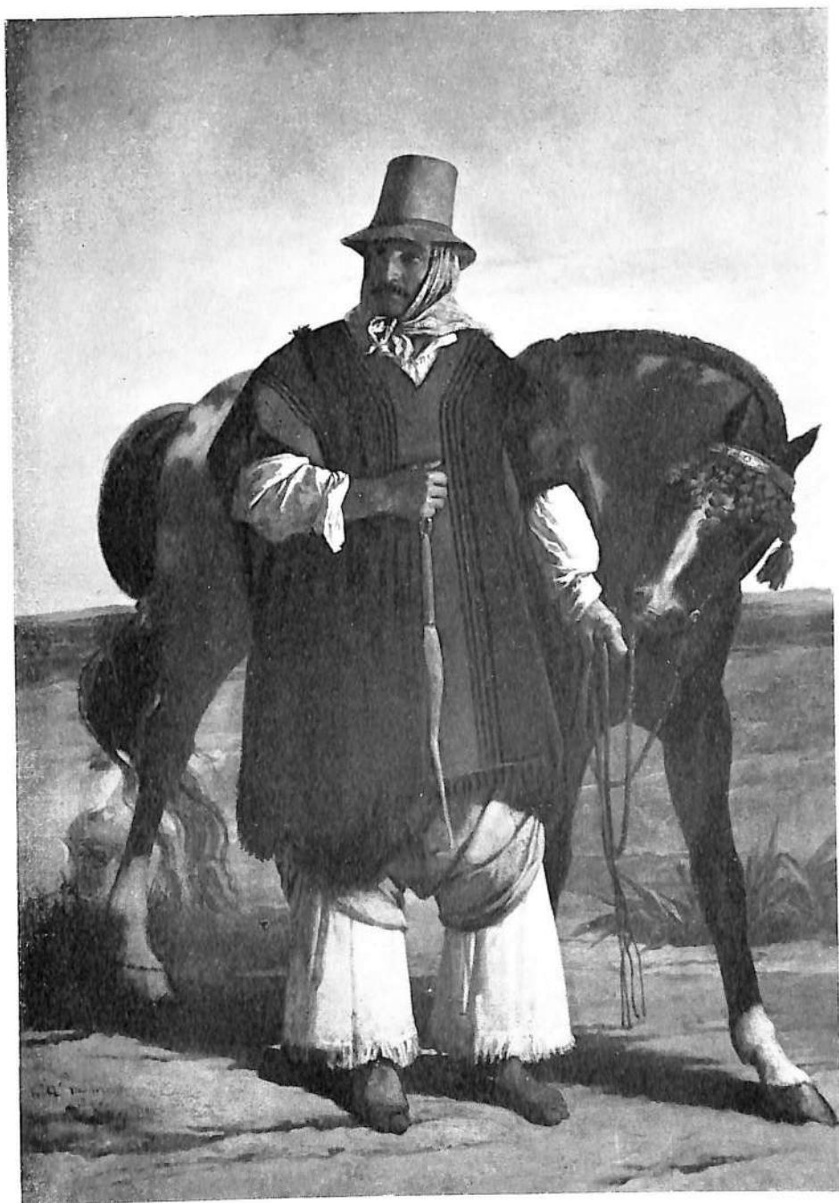
№ 2. Gaucho Federal