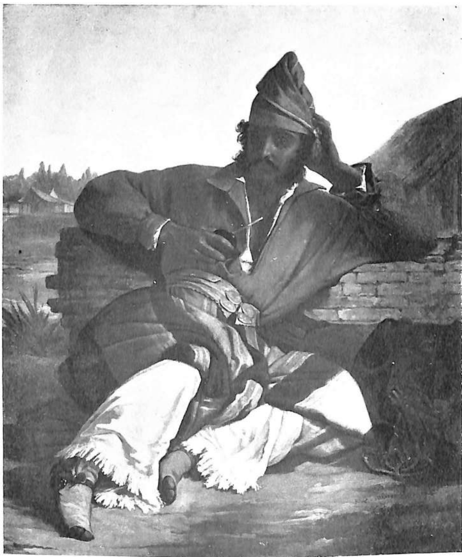
Nº 1. Soldado de Rosas